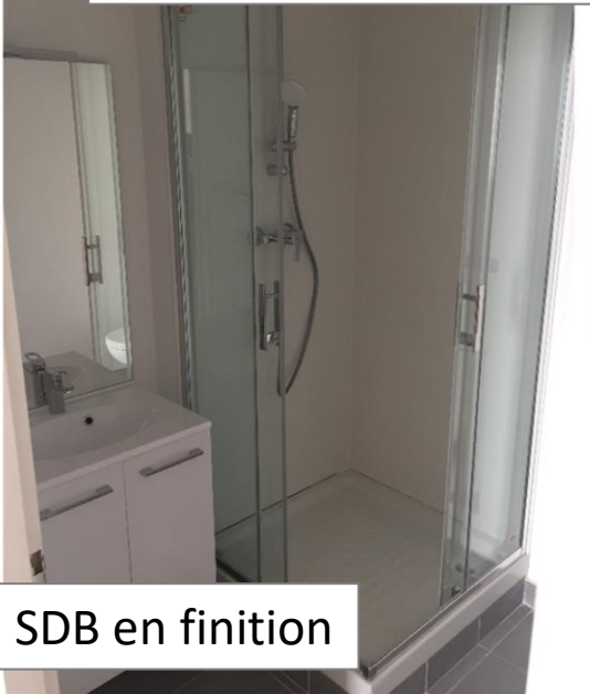
SDB en finition