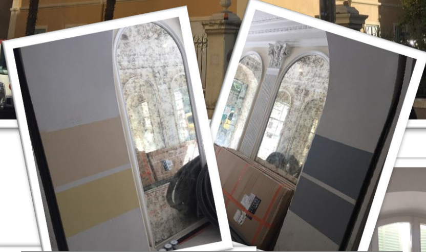
Choix des coloris parties communes