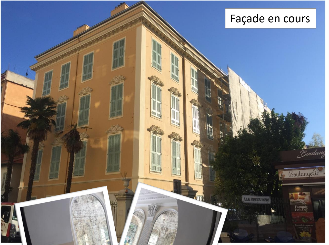
Façade en cours