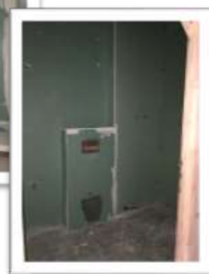
Pose des appareillages sanitaire